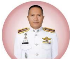
พ.ต.อ.เทอดทูล สร้อยสุขพาพันธ์ รองประธาน