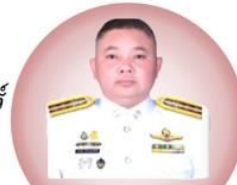
พ.ต.อ.ทรงพล บริบาลประสิทธิ์ รองประธาน