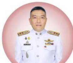
พ.ต.อ.เสกสรร สุขประเสริฐ รองประธาน/ประธานศึกษา/เหรียญกึ่ง