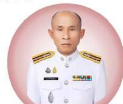
พ.ต.อ.วีระศักดิ์ พิมพ์มีลาย รองประธาน